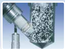
ビーズ噴流洗浄機能付