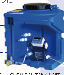
AQUAMATIC CHEMICAL TANK UNIT